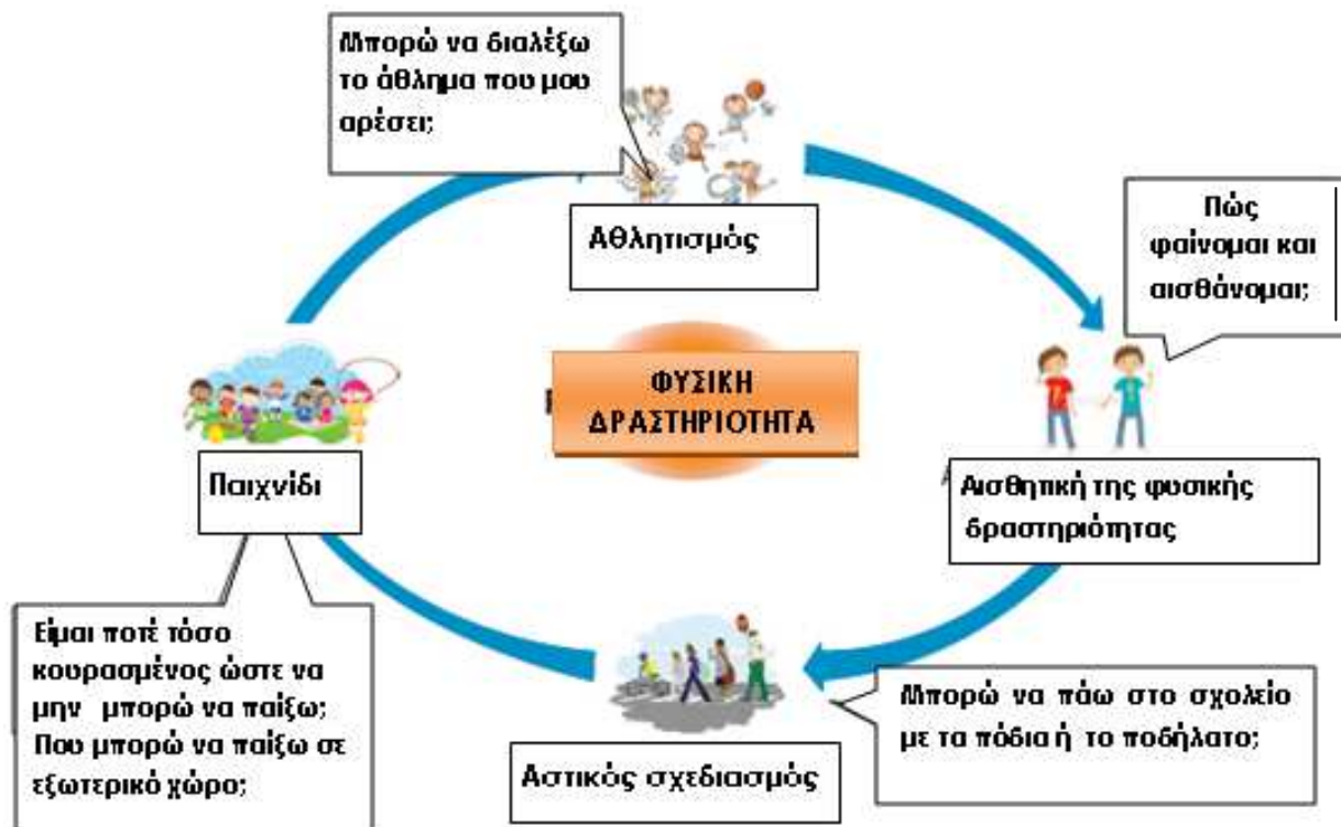
Εικόνα 3. Συνθήκες φυσικής δραστηριότητας (τροποποιημένο από Simovska et al, 2006).

Οι πέντε βασικές αξίες του δικτύου Σχολεία για την Υγεία στην Ευρώπη (SHE) είναι οι εξής: