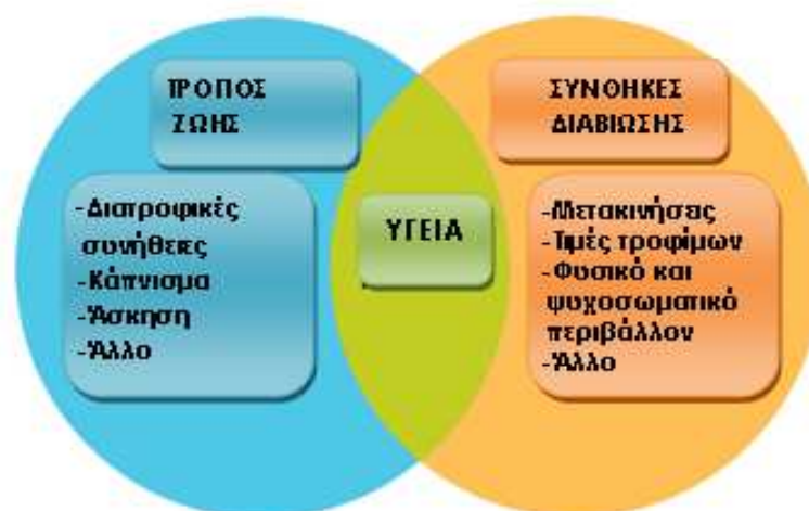
Εικόνα 1. Παράγοντες Υγείας: τρόπος ζωής και συνθήκες διαβίωσης.

Μια ευρεία έννοια για την υγεία εμπεριέχει τόσο τη σημασία του τρόπου ζωής όσο και των συνθηκών ζωής (Simonaska et al, 2006). Τρόπος ζωής (life style) είναι ο τρόπος που ζουν οι άνθρωποι, οι συνήθειες τους, οι επιλογές που κάνουν σε σχέση με την υγεία, συμπεριλαμβανομένων των επιλογών που έχουν σχέση με το φαγητό, τη φυσική άσκηση, την σεξουαλική συμπεριφορά, την χρήση καπνού, την χρήση ουσιών κτλ. Συνήθως τα άτομα έχουν την δυνατότητα να επηρεάσουν τις επιλογές που έχουν κάνει στον τρόπο ζωής τους.