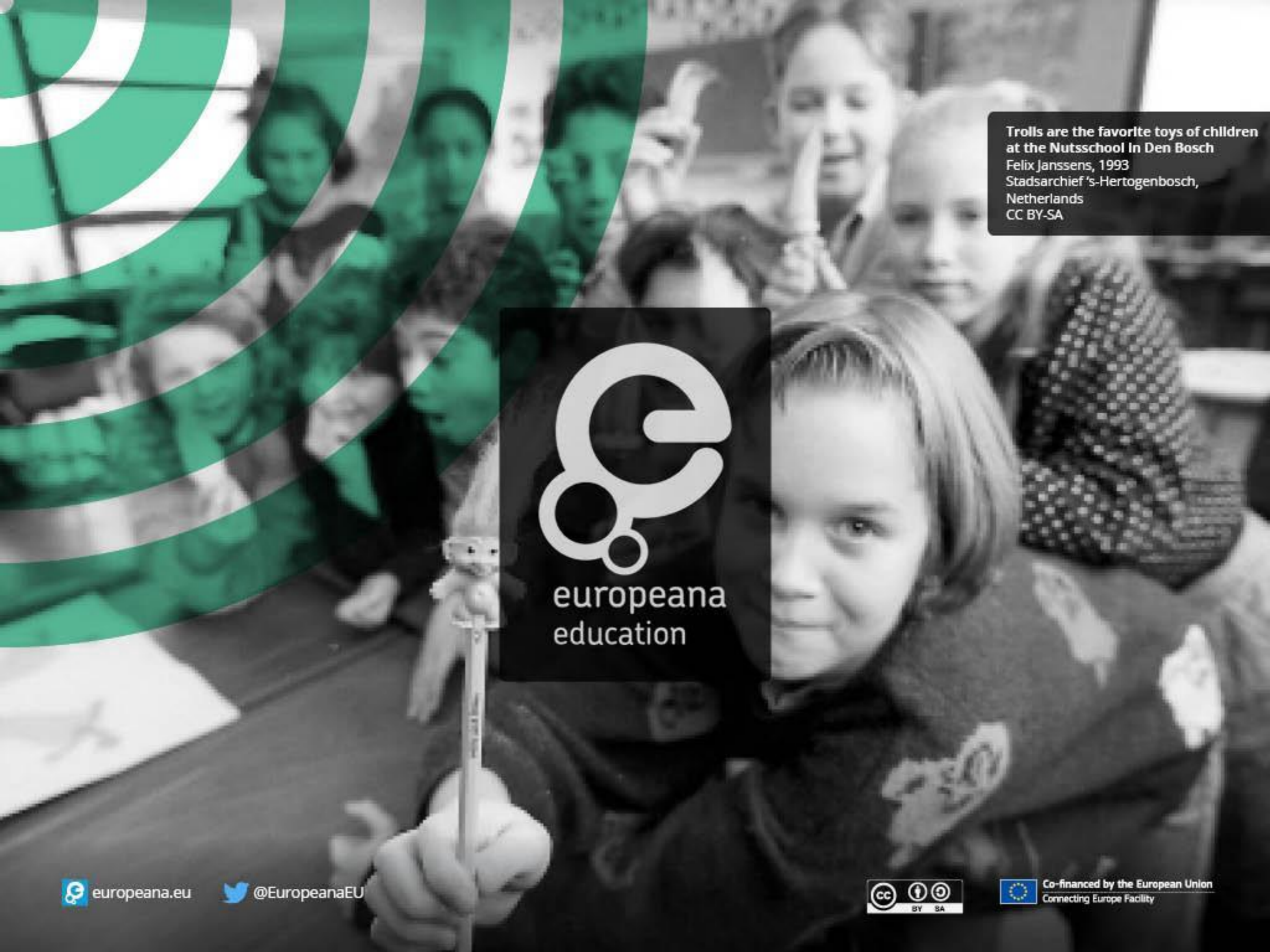
Trolls are the favorite toys of children at the Nutsschool In Den Bosch Felix Janssens, 1993 Stadsarchief 's-Hertogenbosch, Netherlands CC BY-SA